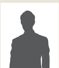
メーカー T 様

知り合いの経営者にさそわれて参加しました。視察に行く前は、「自社がインドとビジネス？できるのかな、本当に…」、というのが正直な気持ちでした。実際に現地を訪れると、インドの活気をありありと感じました。そんな雰囲気の中、視察地でインド人や日本人駐在者のリアルな話を生で聞いたことにより、いろいろなアイデアが生まれてきました。帰国後の現在は、現地で生んだアイデアを商品化するところまでこぎつけました。現地の業法など、調査をしてクリアしなければならない課題は複数ありますが、この目で見て感じ取ったあのインド経済の熱気を思い出しながら、ビジネスの成功に向けてひた走っています。あの時視察に参加していなければ、インドを事業として検討すべきかどうかさえ、いまだに分らないままだったと思います。「分からないから何もしない。」というのは非常にもったいない。まずは自身の目でインドを見てみることを、経営者仲間にも勧めています。アイデアが次々に湧いてくるあの感覚を、体験してほしいと思います。